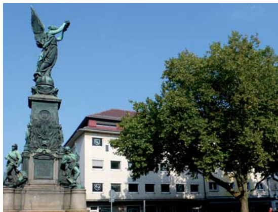
Die Wirtschaftsakademie Freiburg – mitten im Zentrum

Die Globalisierung der heutigen Märkte ist eine enorme Herausforderung. Nehmen Sie diese Herausforderung an – mit einer Ausbildung zum/r Fremdsprachlichen Wirtschaftskorrespondent/in an der Wirtschaftsakademie Freiburg erwerben Sie das Rüstzeug, um sich jetzt und auch in Zukunft im Berufsleben erfolgreich zu behaupten.