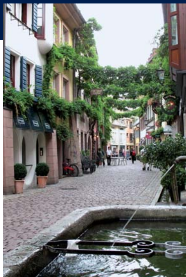
Die Freiburger Altstadt

Eines ist sicher: eine inspirierende Lernatmosphäre trägt zum Erfolg Ihrer Ausbildung bei. Die Wirtschaftsakademie Freiburg liegt mitten im Zentrum der Universitätsstadt Freiburg, nur 10 Gehminuten vom Hauptbahnhof entfernt. Die quicklebendige Stadt mit mediterranem Flair hat eine Menge zu bieten. Zahlreiche kulturelle Veranstaltungen, gemütliche Cafés in der Altstadt, Biergärten unter großen, alten Bäumen, die badi-sche Gastlichkeit und nicht zuletzt die bezaubernde Natur des Schwarzwalds – Freiburg ist zu allen Jahreszeiten eine äußerst lebens- und liebenswerte Stadt.