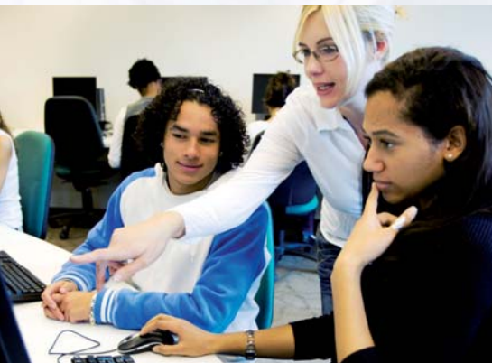
Der Unterricht – Intensiv und lebendig

Erfahrungsgemäß bringen die Studienbewerber/innen in Französisch oder Spanisch sehr unterschiedliche Kenntnisse mit und werden daher bei Beginn der Ausbildung in Spanisch bzw. Französisch in die passende Lerngruppe eingestuft. Falls Sie in das höchste Französisch- oder Spanischniveau eingestuft werden, erhalten Sie vom Beginn der Ausbildung an den Unterricht in den gleichen Teilfächern wie in Englisch. Der Ausbildungsbeginn ist aber auch mit geringen oder gar keinen Kenntnissen in Französisch oder Spanisch möglich. In diesem Fall nehmen Sie Spanisch oder Französisch als Wahl-Fremdsprache und erhalten so Unterricht in der entsprechenden Lerngruppe ab dem Kenntnisniveau, das Sie mitbringen, auch als Anfängerunterricht.